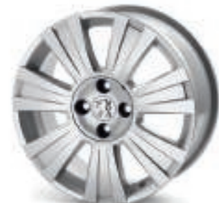
Roue Tanaïka 17"