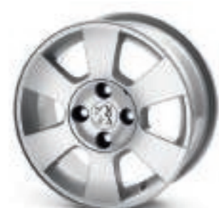
Roue Inca 15"

Ses lignes décontractées et harmonieuses signalent immédiatement Partner Tepee comme un véhicule original, dessiné pour s'aventurer hors des sentiers battus. Avec ces accessoires, affirmez son style inimitable de compagnon futé de toute la famille.