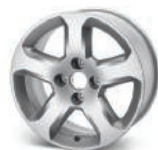
Roue Arenal 16"

Utiles pour éviter les projections de boue ou de gravillons, elles sont en harmonie avec les lignes de Partner Tepee.