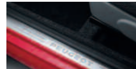
Protecteurs de seuils de portes Jeu de protecteurs en polyuréthane façon alu brossé pour l'esthétique et la protection des bas de marche.