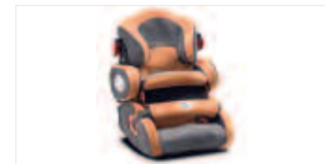
Siège enfant - Groupe 1/2/3 Ce siège auto assure une protection optimale des tout petits, de 9 à 36 kg. Bouclier vendu séparément.