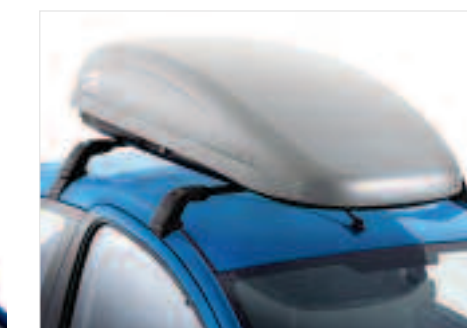
Coffre de toit Ce coffre de toit, au profil aérodynamique, offre un volume utile de 340 litres. Il possède une serrure centrale 2 points.