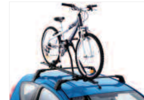
Porte-vélo acier Ce porte-vélo est doté d'un bras de maintien de cadre verrouillable à fixation rapide s'adaptant à la plupart des types de cadre et assurant un montage très facile.

Qui voyage loin en 107, équipe sa voiture : ces accessoires vous garantissent de tout emporter pour pleinement réussir vos vacances ou vos week-ends : coffre de toit, porte-vélo, vous ne manquerez de rien !