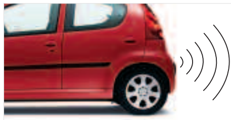
Aide sonore au stationnement arrière Discrets, ses 4 capteurs de proximité intégrés dans le pare-chocs arrière vous seront d'une aide précieuse lors de vos manœuvres en marche arrière.