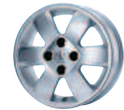
Jante Sborne 14*

Ces jantes en alliage léger affirment le style de 107, tout en offrant toutes les garanties en matière de qualité, sécurité et tenue de route.