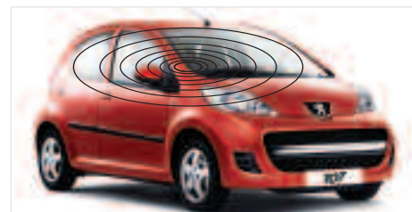
Alarme anti-intrusion Dormez tranquille, cette alarme sur télécommande d'origine assure la protection de votre 107.

Ces accessoires indispensables pour votre sécurité et celle de vos passagers, sont aussi de plus en plus souvent obligatoires dans de nombreux pays. Ils vous permettront d'affronter toutes les difficultés que peuvent vous réserver la route ou la météo et de préserver votre 107 et ses équipements des mauvaises intentions !