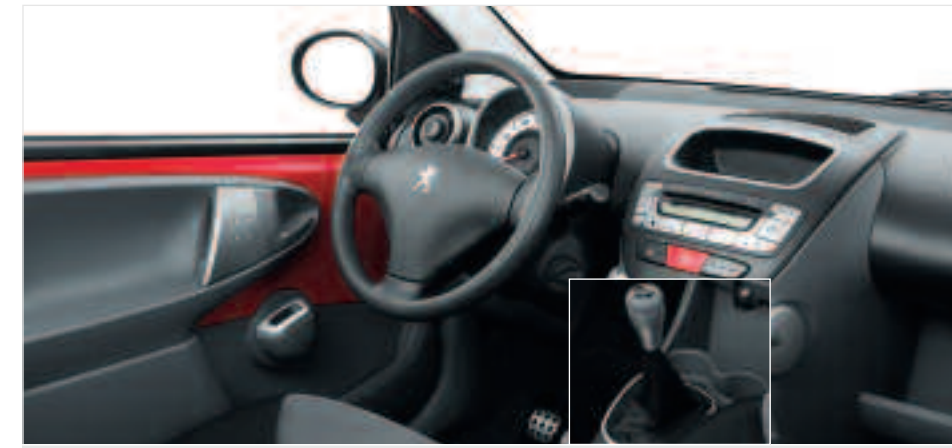
Kit d'habillage intérieur Composé d'un enjoliveur de façade de planche de bord, d'un enjoliveur de soufflet de levier de vitesses et de 2 enjoliveurs de commande de lève-vitres, il renforce l'originalité du design intérieur de 107. Peut-être complété du pommeau de levier de vitesses cuir/aluminium.

Chacun a sa propre idée du confort. Pour donner à votre 107 le confort que vous souhaitez vraiment, choisissez parmi une gamme d'accessoires ingénieux et fonctionnels, ceux qui satisfont vos exigences.