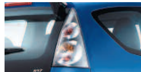
Feux arrière Cristal Ces feux arrière reprennent intégralement les fonctions des feux de série et renforcent le côté tendance de 107.