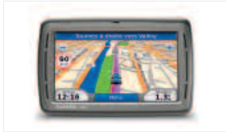
Système de guidage nomade Entrez votre destination à l'aide de l'écran tactile et laissez-vous guider partout en Europe (selon modèle).