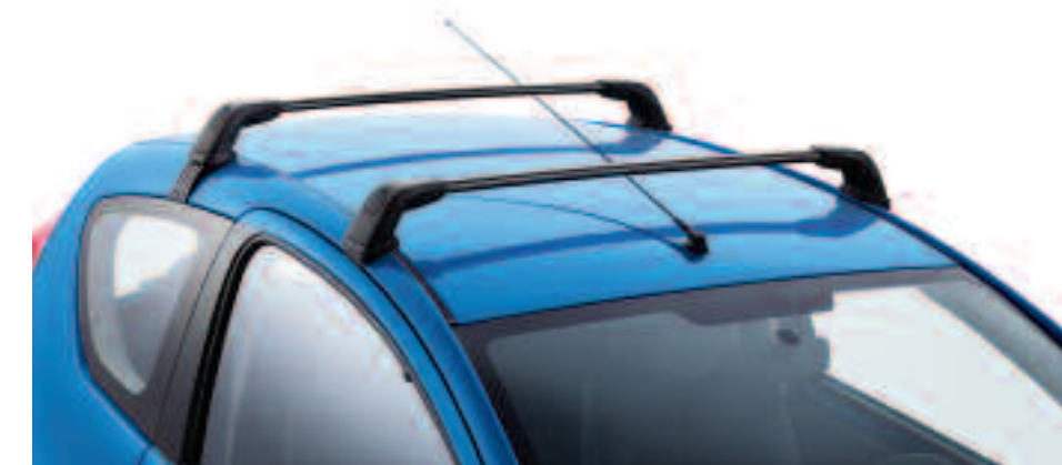
Barres de toit Fonctionnelles, les barres de toit de 107 peuvent recevoir tous les accessoires de la gamme de portage Peugeot.