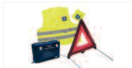
Accessoires de sécurité Éléments indispensables et obligatoires dans certains pays, ces accessoires vous seront d'une aide précieuse en cas d'aléas pendant vos déplacements.