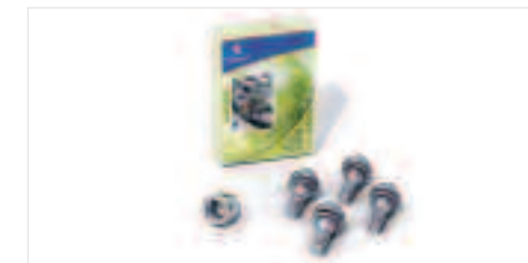
Antivol de roues Les vis antivol protègent vos roues de tout démontage malintentionné.