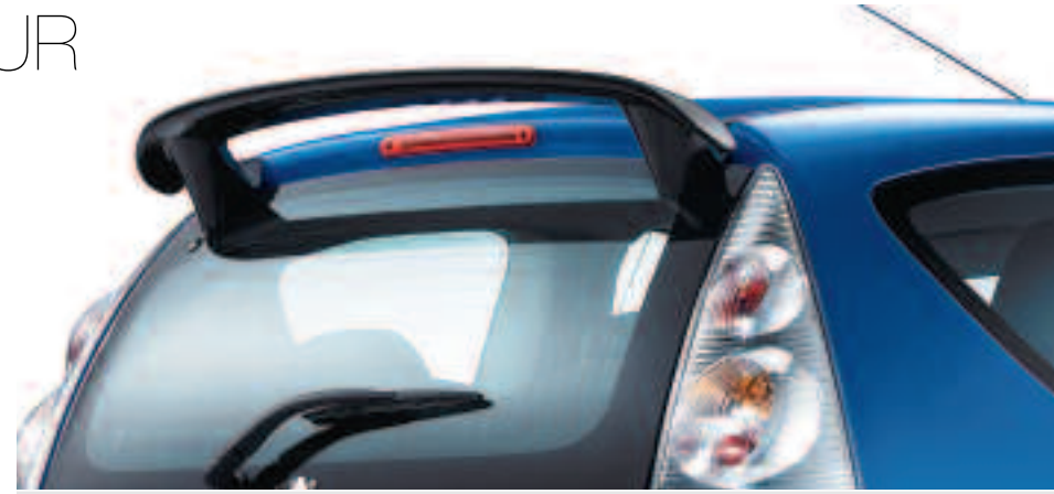
Becquet de hayon Ce becquet s'intègre parfaitement avec les lignes de 107 et accentue son allure dynamique. Livré non peint.

Votre 107 a une sacrée personnalité. Équipez-la de quelques accessoires dessinés spécialement pour elle, et vous en ferez une personnalité unique, reconnaissable entre toutes. Vous allez l'adorer !