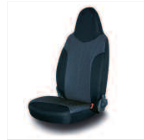
Housses de siège Carbone Confectionnées sur mesure pour 107, ces housses de siège se montent rapidement et sont compatibles avec les airbags latéraux (suivant modèle).