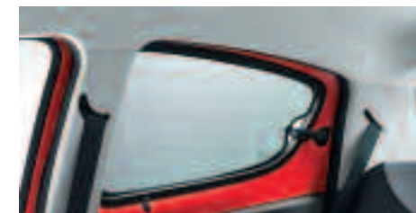
Stores pare-soleil latéraux Pratiques, ils s'installent en quelques secondes et permettent une occultation totale des vitres. Existe en version store de lunette arrière.