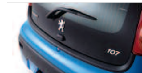
Protecteur de seuil de coffre Il s'intègre parfaitement aux lignes de votre 107 et protège votre carrosserie lors des chargements ou déchargements d'objets encombrants.