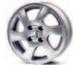
Jante Nemos 14**