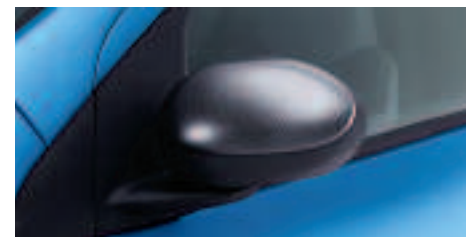
Coques de rétroviseur aspect carbone Seules ou en complément du diffuseur, elles sont disponibles en aspect aluminium.