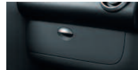
Couvercle de boîte à gants La boîte à gants de la planche de bord peut recevoir un volet de fermeture pour ranger en toute discrétion vos objets quotidiens.