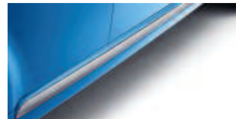
Baguettes aspect aluminium pour 107 5 portes Les baguettes de bas de caisse renforcent le caractère enjoué de 107. Disponibles en aspect carbone.