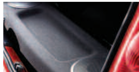
Câble auxiliaire audio Profitez pleinement de votre baladeur CD ou de votre lecteur MP3. Grâce à ce câble, vous bénéficiez d'une qualité sonore optimale.