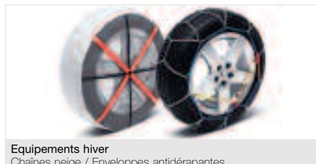
Equipements hiver Chânes neige / Enveloppes antidérapantes Equipements parfois obligatoires, les chânes neige sont nécessaires pour la conduite sur route enneigée. Pour des besoins ponctuels, les enveloppes antidérapantes vous apporteront un grand confort de conduite.