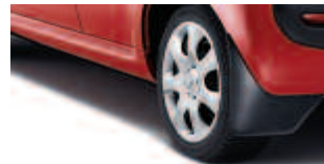
Bavettes de style Discrètes, ces bavettes vous seront très utiles pour éviter les projections de boue ou de gravillons.