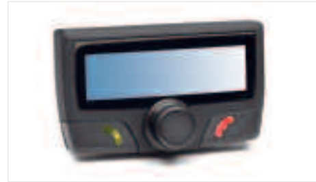
Kit mains libres Bluetooth® Gardez les mains sur le volant et conversez tout en laissant votre portable GSM compatible Bluetooth® dans votre poche ou votre sac à main.

Kit mains libres, système de guidage, aide au stationnement..., l'usage de ces accessoires au quotidien vous rendra la vie à bord encore plus agréable.