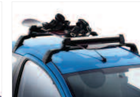
Porte-skis/surf aluminium Le porte-skis avec fonction antivol intégrée permet de transporter 4 à 6 paires de skis en toute sécurité ou de combiner skis, monoskis et surf des neiges.