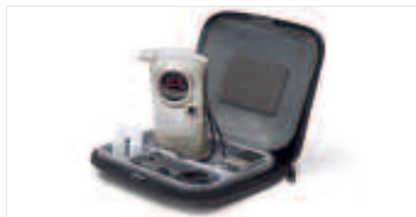
Ethylotest Ne vous laissez pas surprendre. Lorsque vous avez consommé de l'alcool, ayez le réflexe éthylotest.