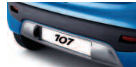
Kit d'habillage aspect aluminium Ce kit, constitué d'un diffuseur et de 2 coques de rétroviseur, personnalise dans le détail votre 107.