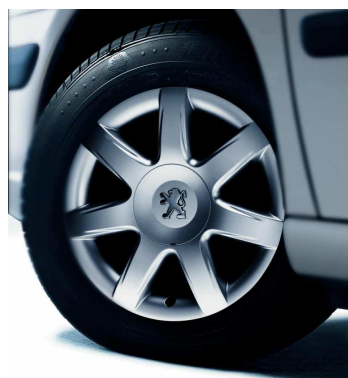
Jantes Alliage 16" Hadès et détecteurs de sous-gonflage