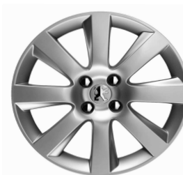
Jante alliage MAGNETIK 18"