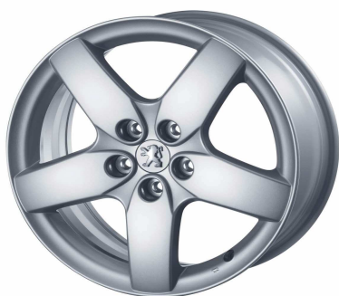
Jantes alliage Quasar 16"

Sur Signature, toutes les jantes alliage sont accompagnées en série de détecteurs de sous-gonflage.