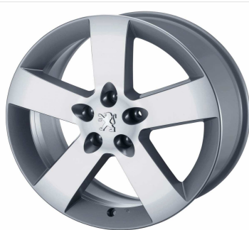
Jantes alliage Hortaz 16"