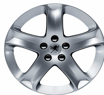
Jantes alliage Cosmos 17"