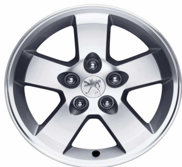
Jante alliage Manyara 16"