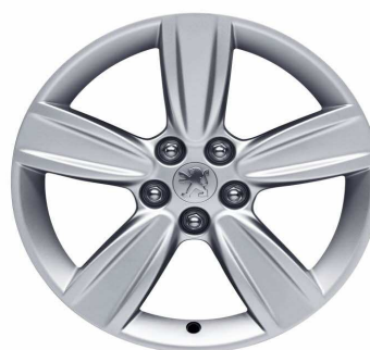
Jante alliage Tanganyika 18"