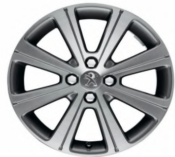
Jante alliage Melbourne 17"