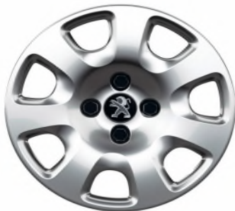
Enjoliveur Atacama 15"