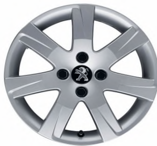
Jante alliage Santiaguito 2. 16"