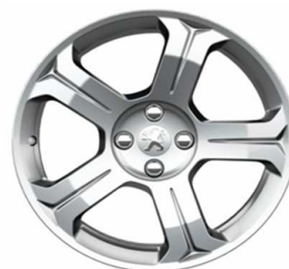
Jante alliage Licancabur 18"