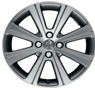
Jante alliage Melbourne 17"