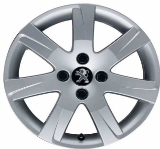
Jante alliage Santiagoito 2. 16"