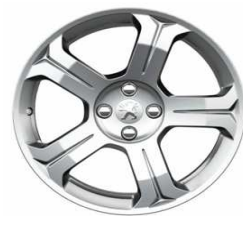
Jante alliage Lincancabur 18"