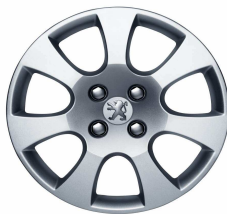
Enjoliveur Toliman 16"