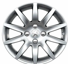
Jante alliage Izalco 16"