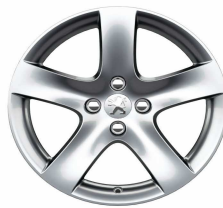
Jante alliage Rinjani 17"