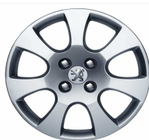
Enjoliveur Toliman 16"