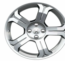
Jante alliage Licancabur 18"