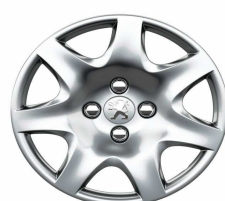
Enjoliveur Pacaya 15"