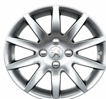
Jante alliage Izalco 16"