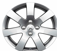
Jante alliage Santiaguito 16"