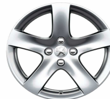
Jante alliage Rinjani 17"