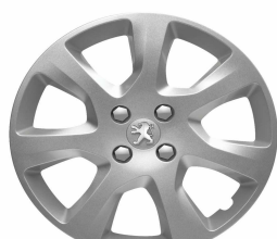
Enjoliveur ATAX 17"

Toutes les jantes de 3008 sont chaînables. Les jantes 17" et 18" sont chaînables avec jeux réduits.