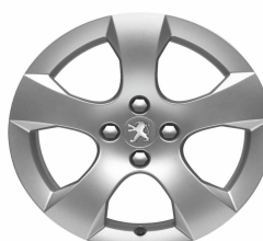
Jante alliage SAVARA 17"