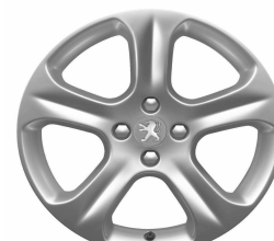
Jante alliage EXONA 18"