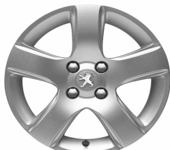
Jante alliage ISARA 16" (Uniquement avec option Grip Control)