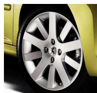
Jantes Hockenheim 17"