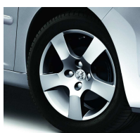
Jantes Canberra 16"