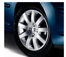
Jantes Estoril 16"