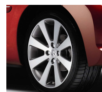
Jantes Melbourne 17"