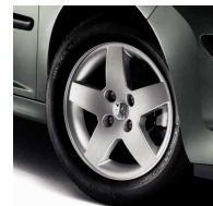
Jantes Monaco 15"