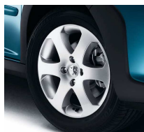
Jantes Outdoor 16"