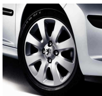
Enjoliveur Hobart 15"