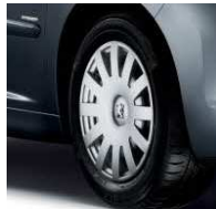
Enjoliveur Eagle 15"