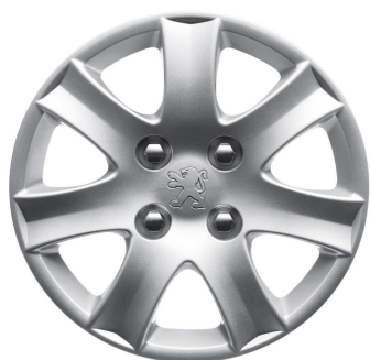
Enjoliveur SPA 14"