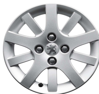
Jante Interlagos 15"